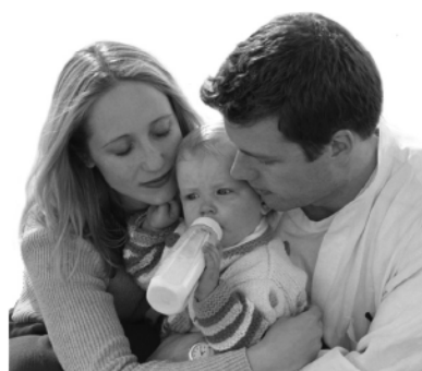
● Каждый хочет найти маму

После оформления документов и при передаче ребенка в